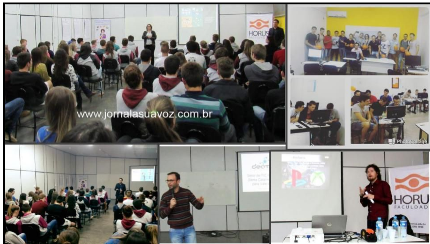
Semana do conhecimento - Sistemas de Informação