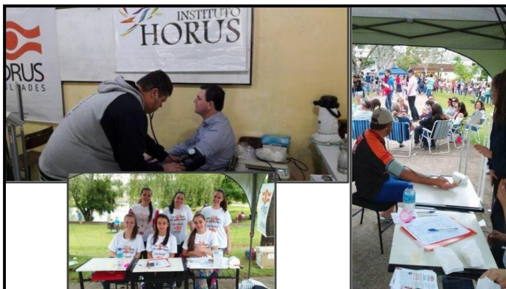
Evento Horus Saúde e Rua do Lazer no dia da criança

A preocupação com o desenvolvimento regional está implícita na missão da instituição. A Horus Faculdades atua na região centro oeste de Santa Catarina, abrangendo em média 22 municípios. A inserção regional se dá no ensino e na extensão, nas atividades de pesquisa e, principalmente na formação de profissionais para o mercado de trabalho. Prova disso é a atuação da Horus em São Miguel do Oeste, município distante a 79 km.