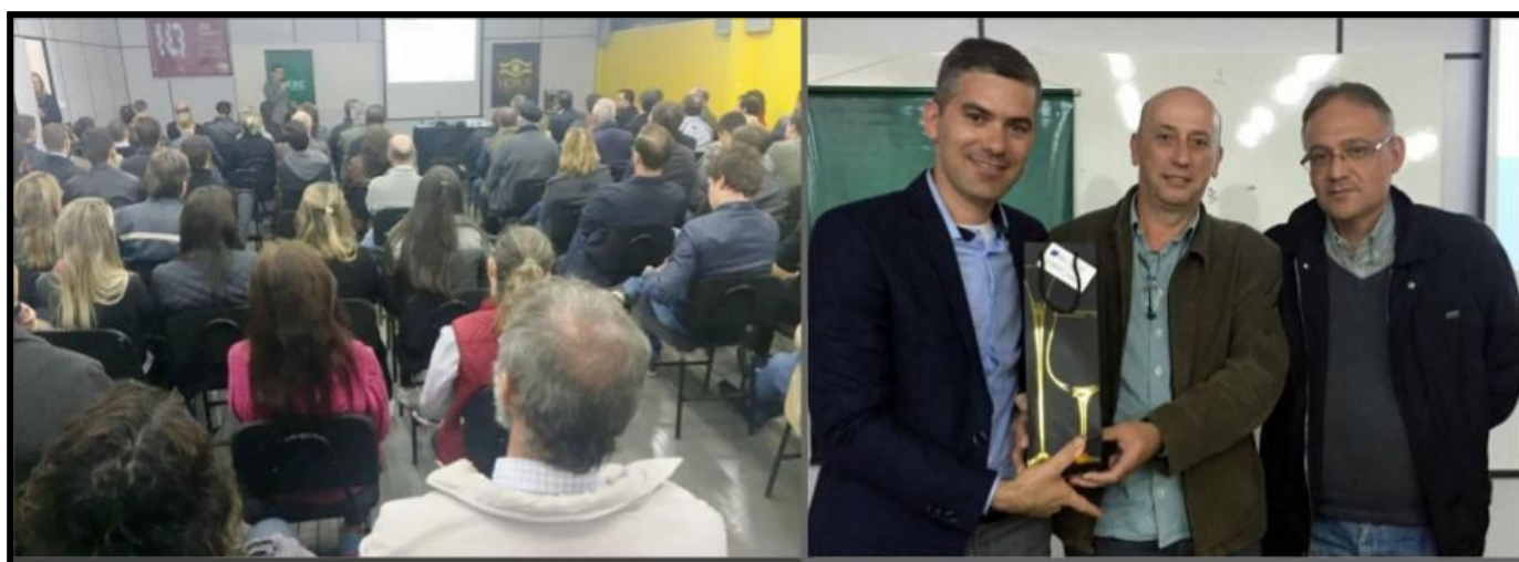
Seminário para o dia da indústria