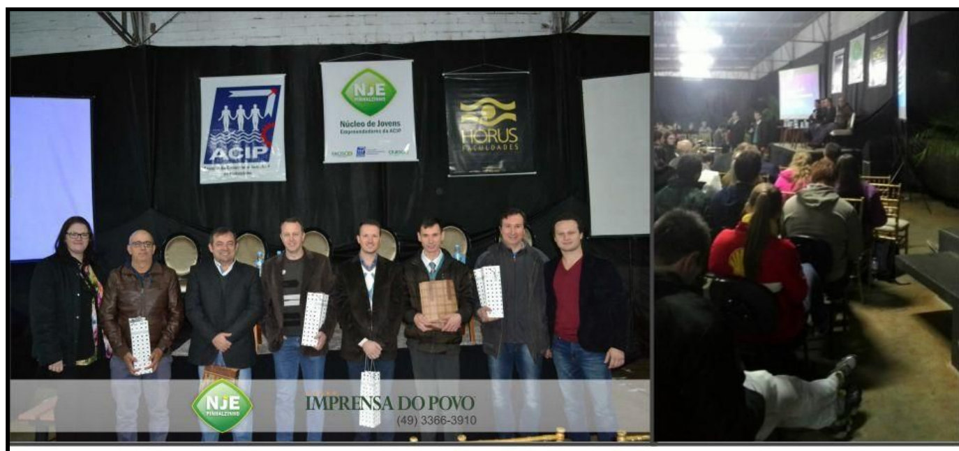
Comemoração da Semana Estadual do Jovem Empreendedor de Santa Catarina

Com o objetivo de proporcionar aos acadêmicos a construção do conhecimento a partir do cenário globalizado, na noite do dia 06 de junho de 2016, na Horus Faculdades foi realizado um painel com o tema Como Crescer em Tempos de Crise, em comemoração da Semana Estadual do Jovem Empreendedor de Santa Catarina. Realizado pelo Núcleo de Jovens Empreendedores (NJE) da Associação Comercial e Industrial de Pinhalzinho (Acip), com o apoio da Federação das Associações Comerciais e Industrial de Santa Catarina (Facisc) e Conselho Estadual de Jovens Empreendedores de Santa Catarina (Cejesc).