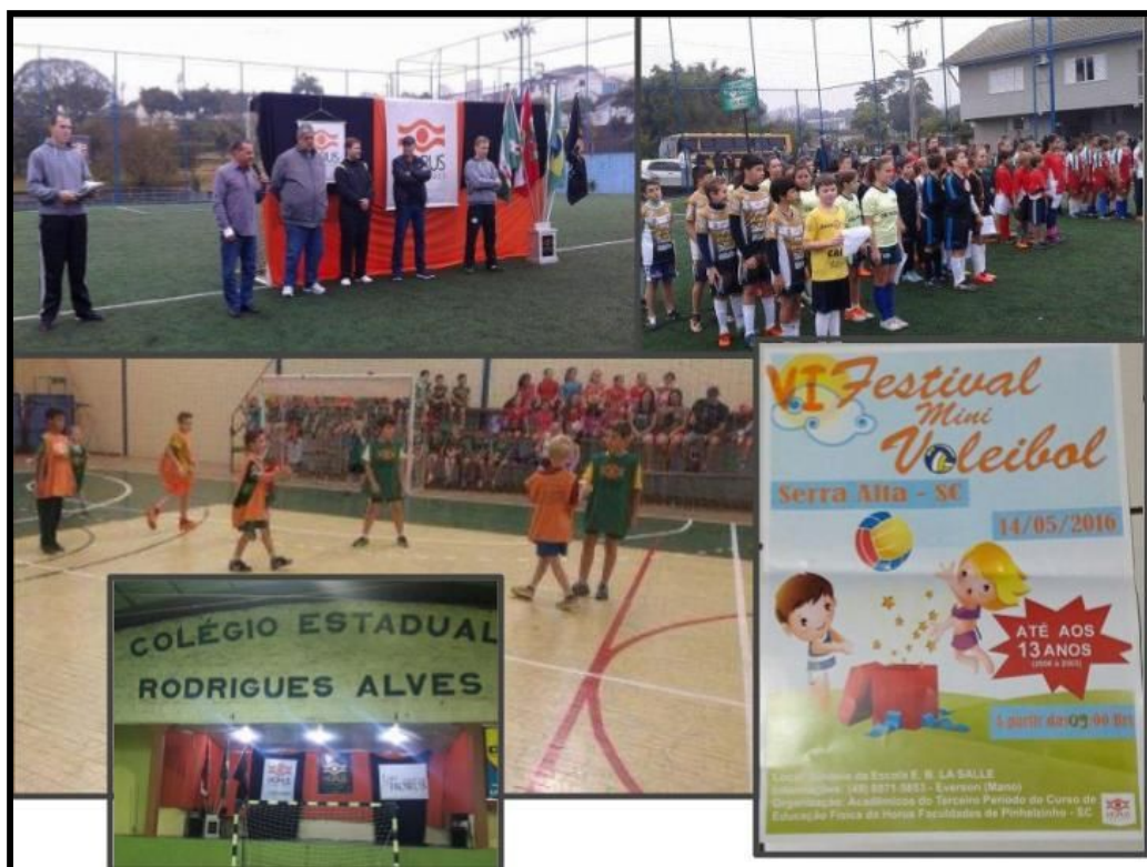
1º Festival de Horus Mini-Futebol, Festival Horus Mini-Handebol e Festival Mini-Voleibol