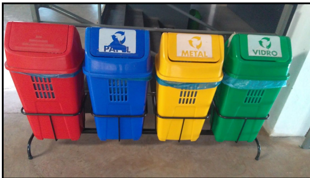
Lixeiras na Horus Faculdades

Dentro do aspecto de políticas de extensão, a Horus possui Políticas de formação e capacitação docente, previstas num projeto de formação anual; Política de capacitação do corpo técnico-administrativo, através de um programa nos moldes dos docentes e Sustentabilidade financeira – orçamento com dotações, aprovado pelo Conselho Superior, que permita visualizar a gestão do ensino, pesquisa e práticas de extensão; Plano de carreira de todo corpo técnico, administrativo e docente, em fase de revisão pelo Conselho Superior.