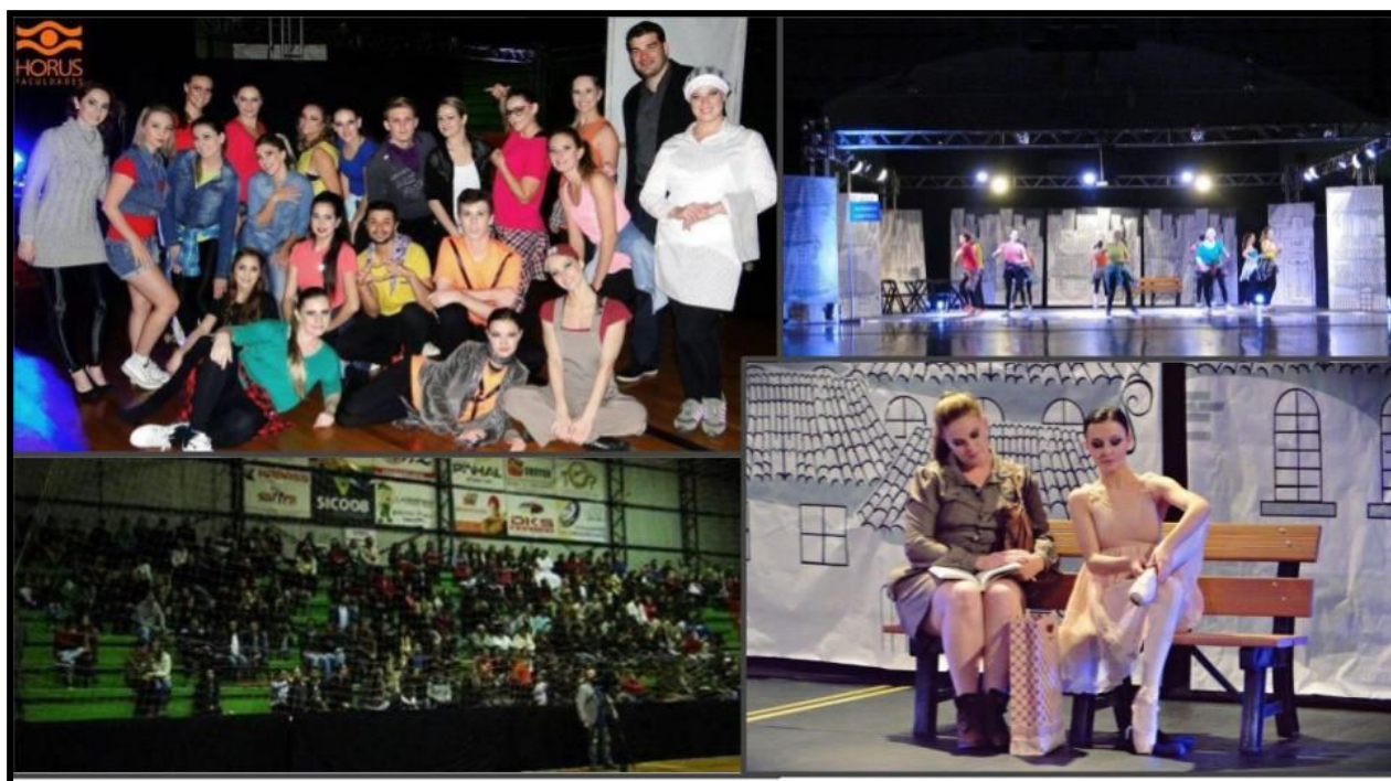
Apresentação do espetáculo de dança “Avenida Central”, no Centreventos de Pinhalzinho.