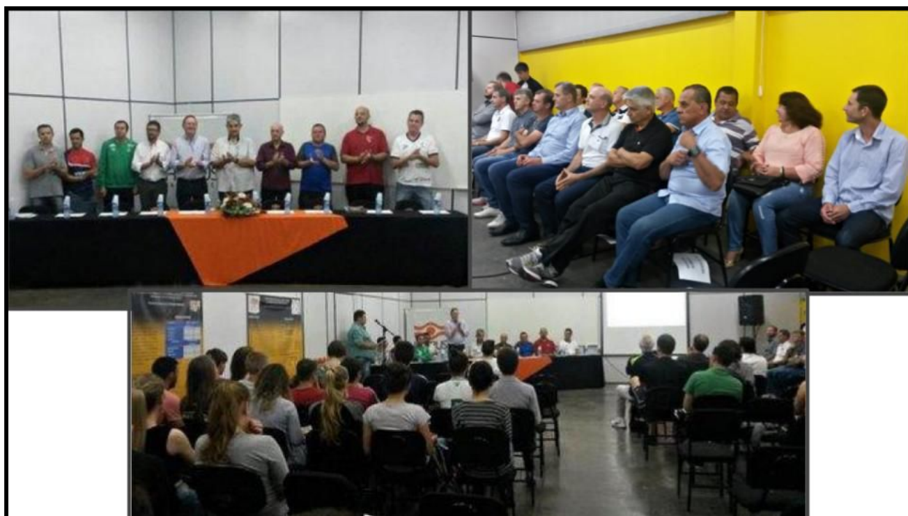
Programação da semana do conhecimento - Educação Física